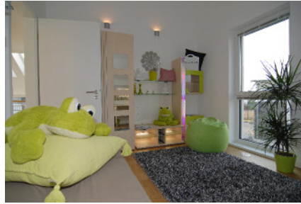
Dateiname: STREIF Musterhaus Frechen Kind