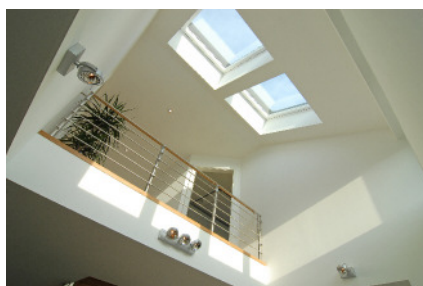
Dateiname: STREIF Musterhaus Frechen Galerie