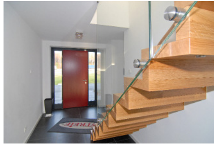
Dateiname: STREIF Musterhaus Frechen Treppe