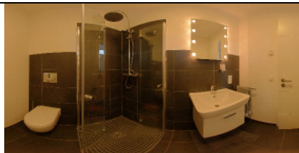
Dateiname: STREIF Musterhaus Frechen GaesteWc