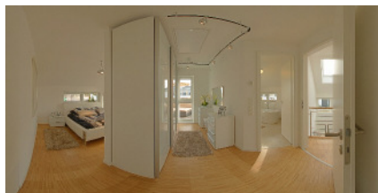
Dateiname: STREIF Musterhaus Frechen SchlafZim