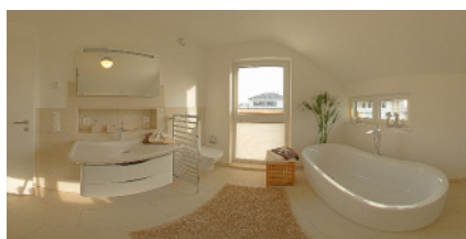
Dateiname: STREIF Musterhaus Frechen Master-Bad Pan