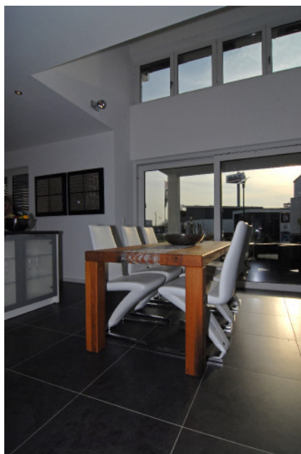
Dateiname: STREIF Musterhaus Frechen Essen