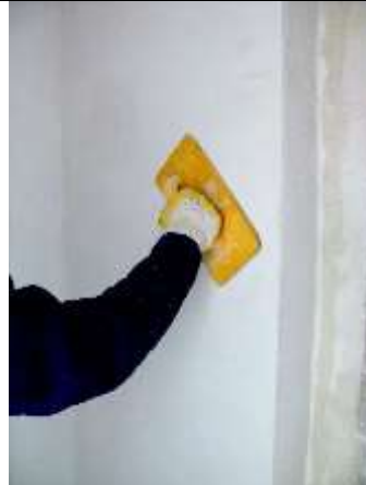
4. Abreiben der Oberfläche von INTRASIT RZ 2 Dateinamen: S03Bild4